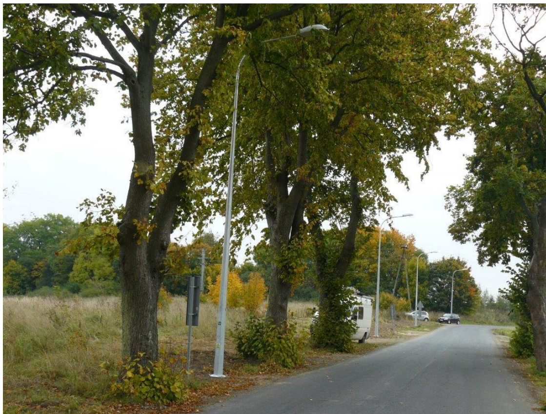
Oświetlenie drogi w Głowaczewie