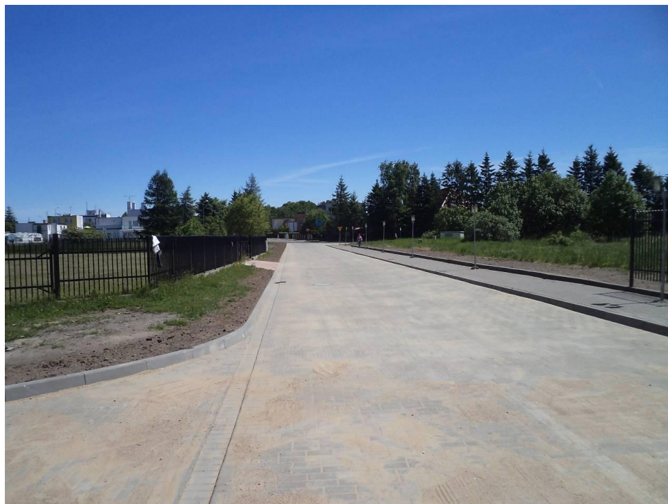
Przebudowana ul. Borkowska w Grzybowie