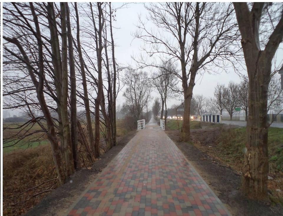
Ścieżka rowerowa Zieleniewo – Przećmino