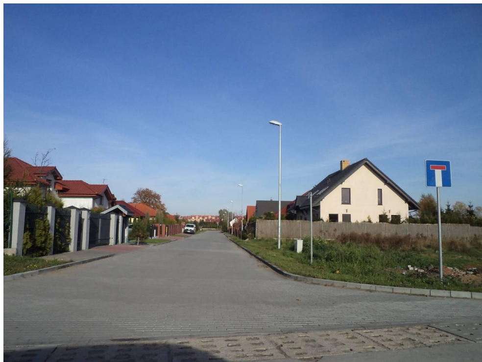
Przebudowana ul. Kwiatów Polskich w Zieleniewie