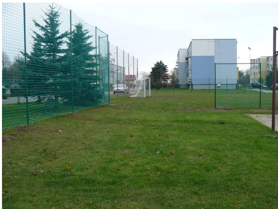
Ogrodzenie boiska w Zieleniewie