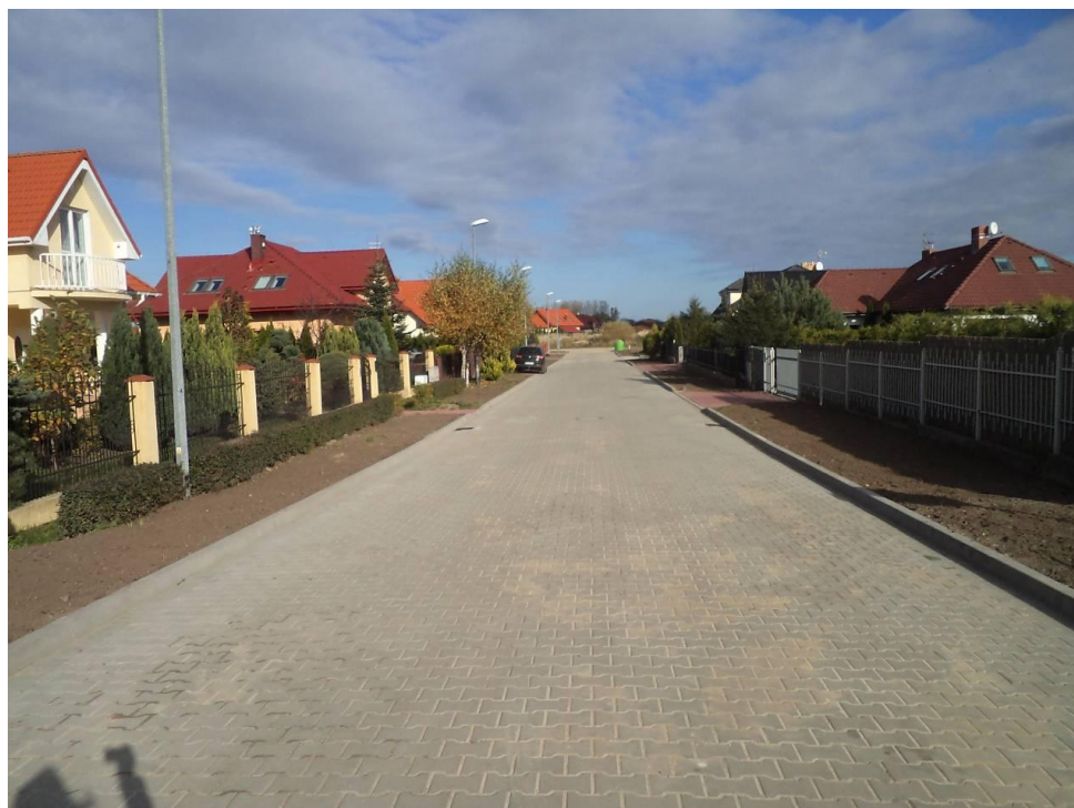
Przebudowana ul. Morełowa w Zieleniewie