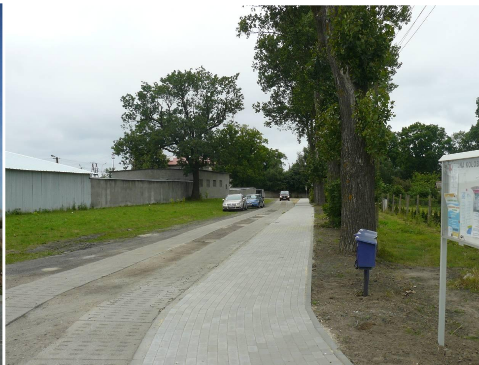
Chodnik w Kądzielnie