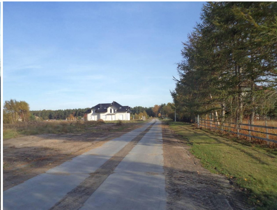
Drogi z płyt - Ul. Malinowa w Grzybowie