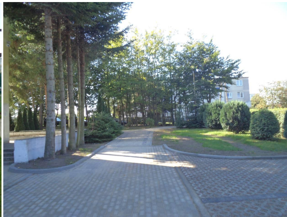
Modernizacja nawierzchni placów i chodników na terenie szkół w Drzonowie