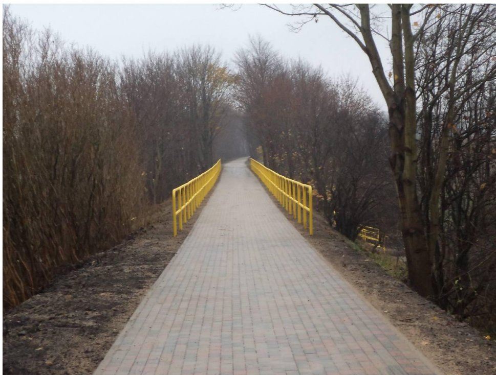
Ścieżka rowerowa Zieleniewo – Przećmino