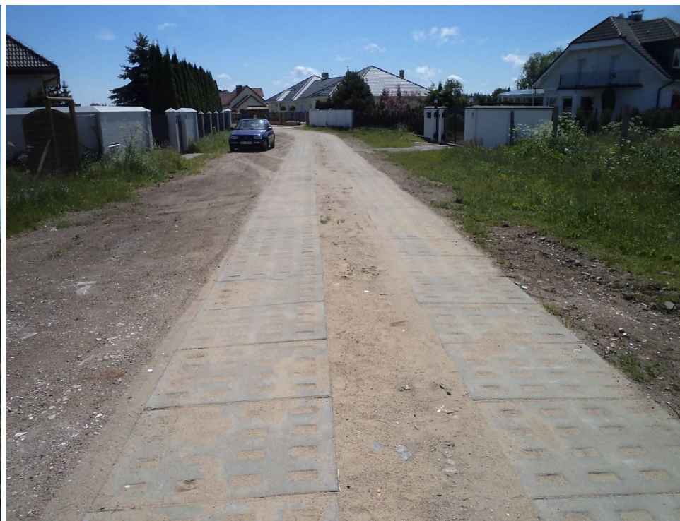
Drogi z płyt - Ul. Wiosenna w Grzybowie