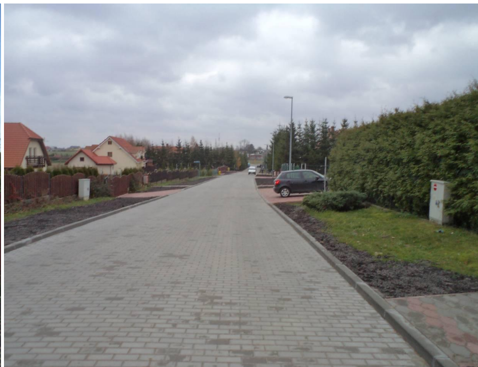
Przebudowana ul. Perłowa w Niekaninie