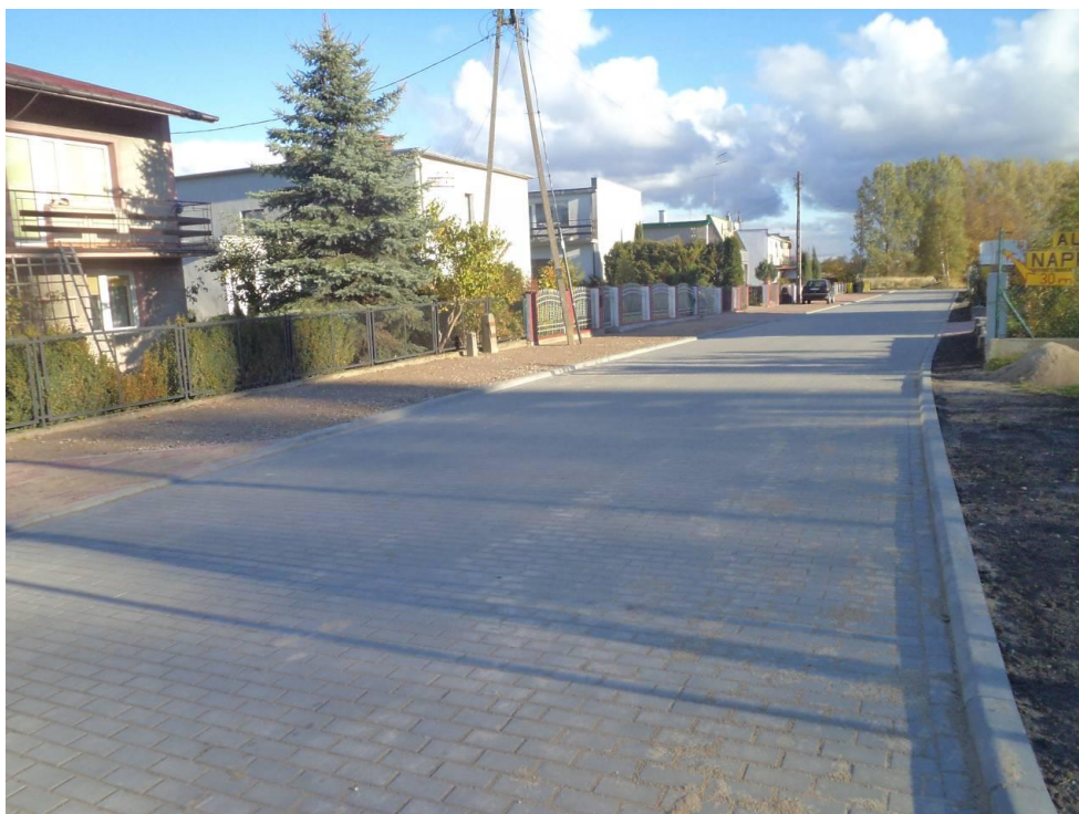
Przebudowana ul. Poziomkowa w Korzystnie