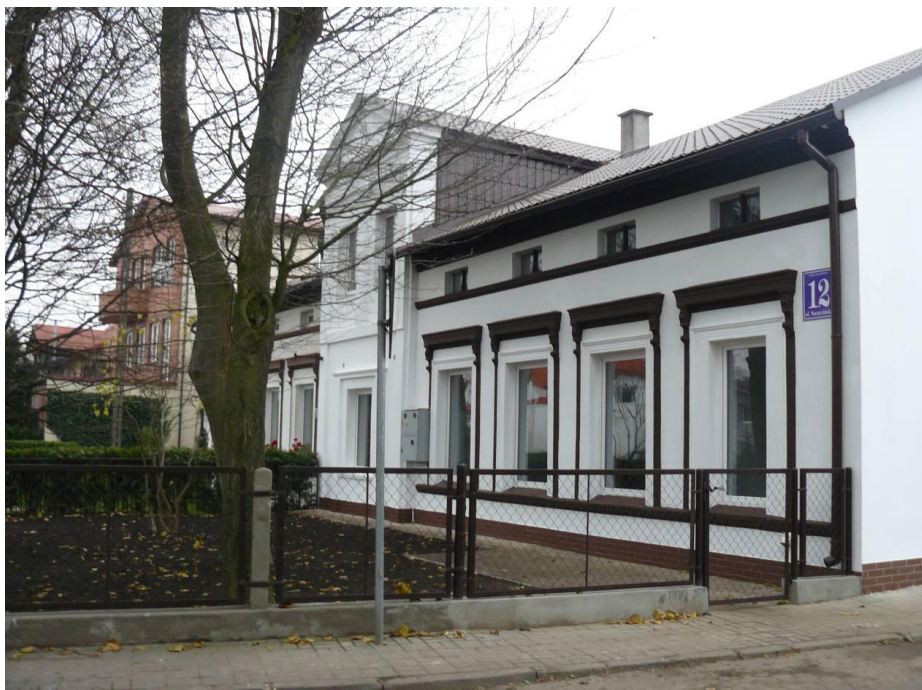
Modernizacja świetlicy w Zieleniewie