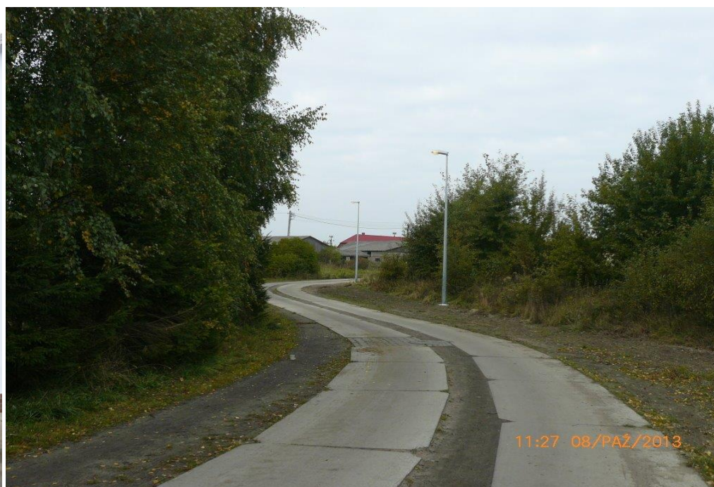
Oświetlenie ul. Bażanciej w Zieleniewie