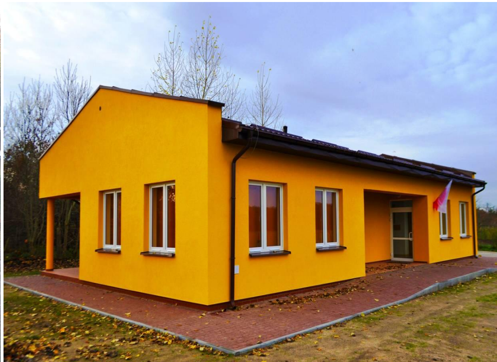
Budowa świetlicy w Rościeniu