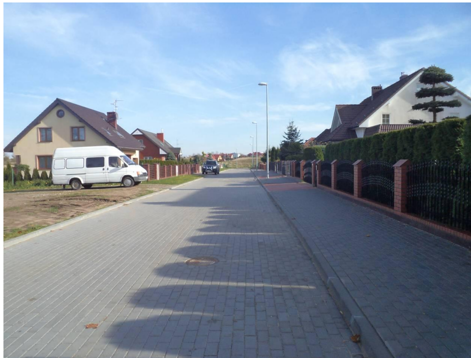
Przebudowana ul. Porankowa w Niekaninie