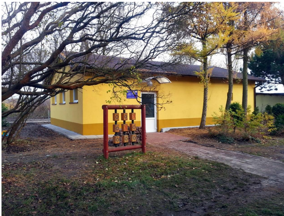
Rozbudowa świetlicy w Grzybowie