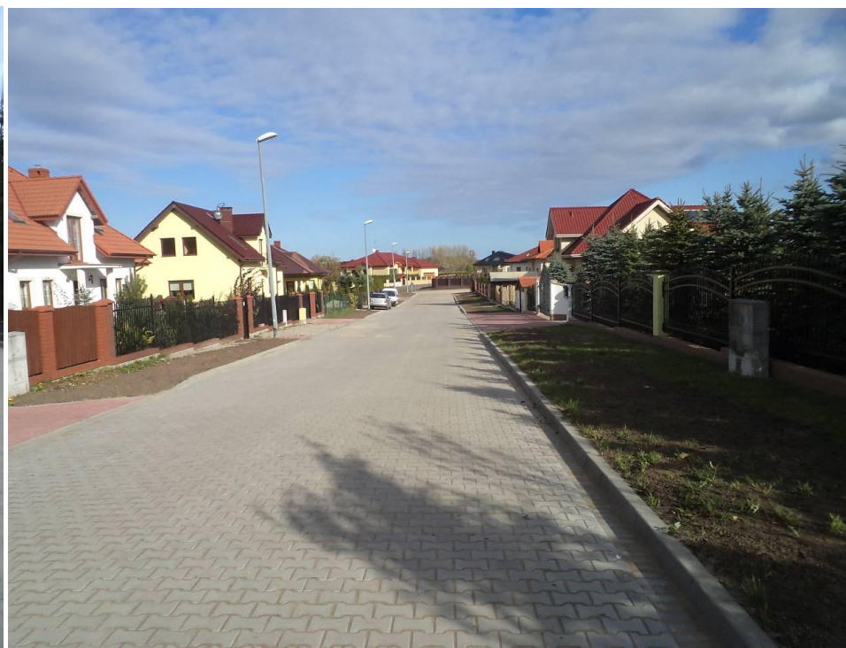
Przebudowana ul. Brzoskwiowa w Zieleniewie