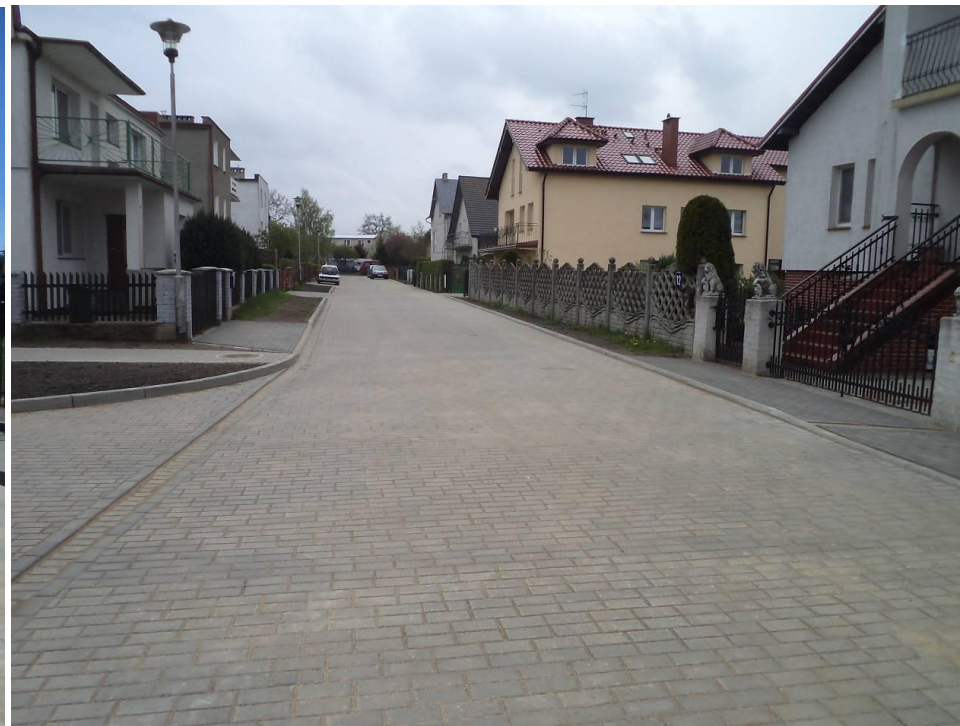
Przebudowana ul. Ogrodowa w Grzybowie