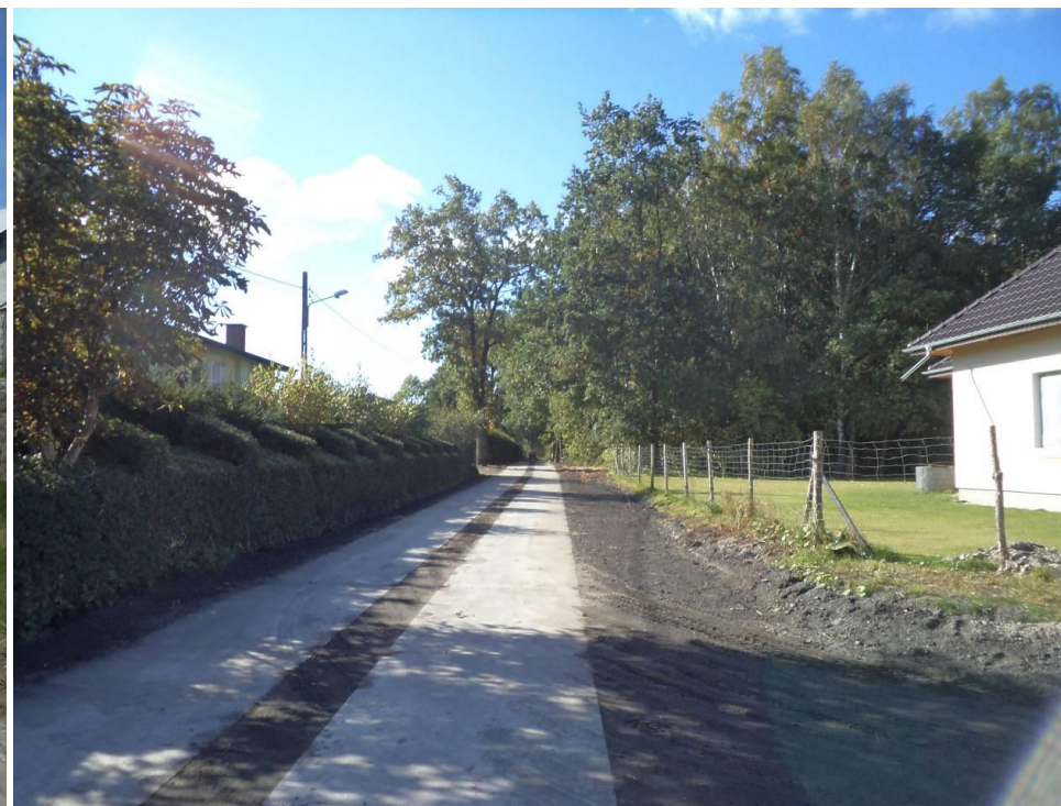
Drogi z płyt - Ul. Wypoczynkowa w Zieleniewie