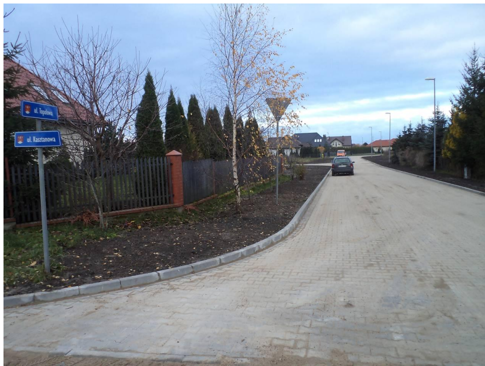
Przebudowana ul. Topolowa w Budzistowie