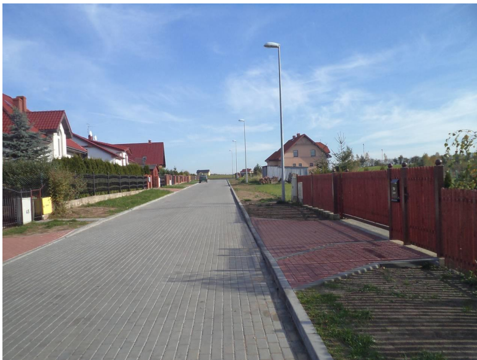
Przebudowana ul. Spokojna w Niekaninie