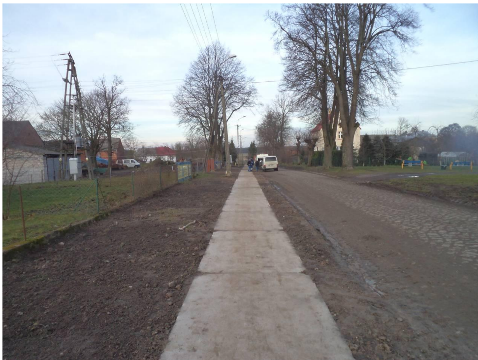
Chodniki przy drogach powiatowych – chodnik w Przećminie