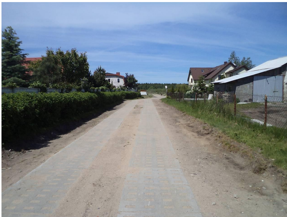
Drogi z płyt - Ul. Kotwiczna w Grzybowie