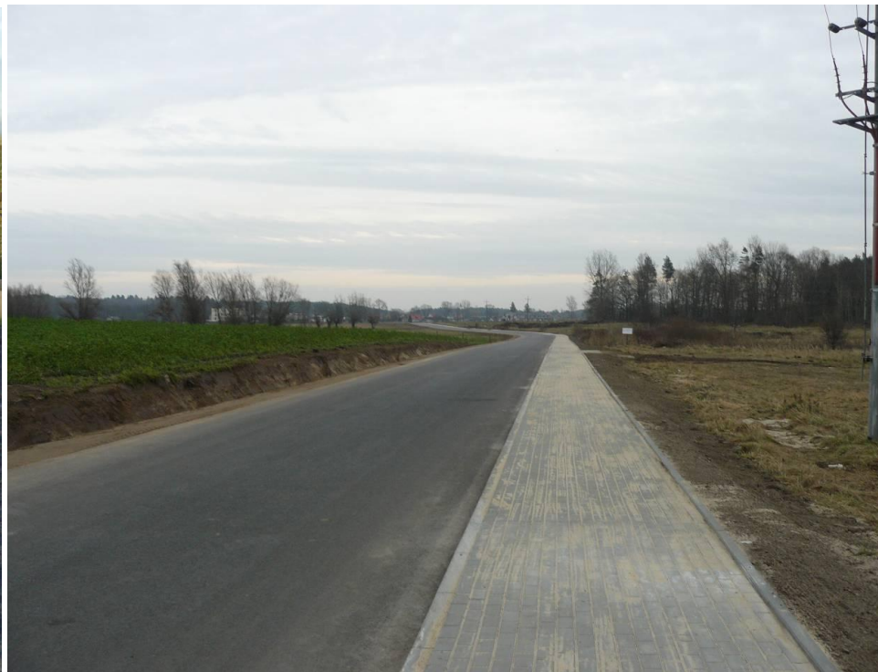
Przebudowana droga w Rościeniec ul. Zgodna